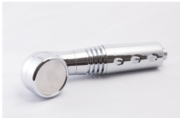
AquaPaladin® Shower Safe chrom