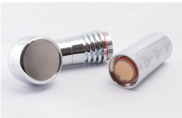
AquaPaladin® Shower Safe chrom