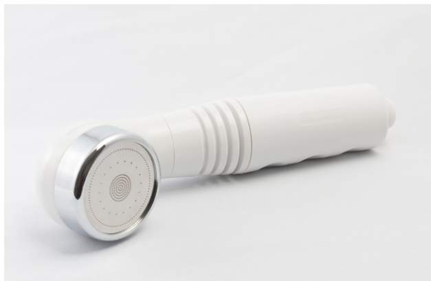
AquaPaladin® Shower Safe white