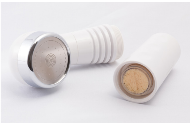
AquaPaladin® Shower Safe white